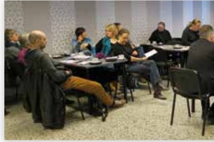
Yrityksille järjestettiin infoaamukahveja Keuruulla, Multialla ja Petäjävedellä. Kuvassa infokahvit Petäjävedellä.