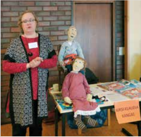
Sote-messut, sotetapaamiset ja soteen valmistautumisessa mukana oleminen.