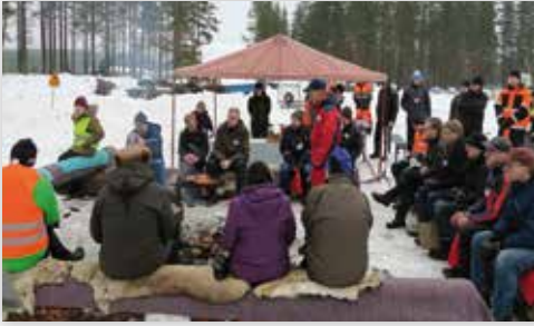
Metsätärskyt Multialla 10.3.