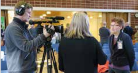
Rekryt kokosivat seurakuntakeskuksen täyteen osallistujia, vastuujärjestäjänä Keulink Oy. Työpaikkoja tarjolla maaliskuun ja marraskuun rekryissä yhteensä n. 490 kpl.